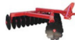
Disc Harrows / Gradas de discos